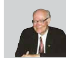
Юрий ЯКОВЕЦ академик РАН

We have unique experience in finding ways to a dialogue. I believe that the whole history of our country is connected with a dialogue of civilizations, with their interactive communication. This must be respected. We are looking forward to serious scrutinizing of the next stage that is offered to us so that we could develop our own behavior and that can be defined as the transition from the dialogue of civilizations through cooperation to inter-civilization integration. The subject is very interesting and difficult to develop; we must find the